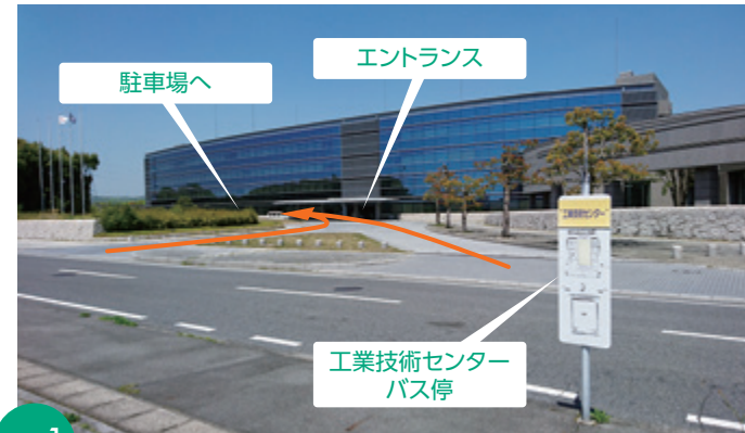
写真1 テクノサポート岡山正面

岡山駅⑥番乗り場より、中鉄バスの 「芳賀佐山団地・リサーチパーク」行きに乗車。 約40分「工業技術センター」下車すぐ。(写真1・地図1・2参照)