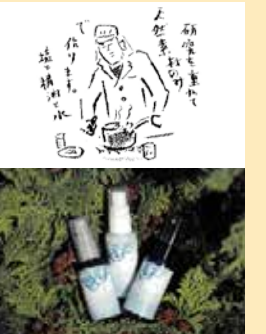
社の清浄 (商標第 6286932 号) 社のしずく (商標第 6303350 号)

商標権取得や販路開拓等の専門的な支援を気軽に相談できました。今後も更なるご支援をお願いします。