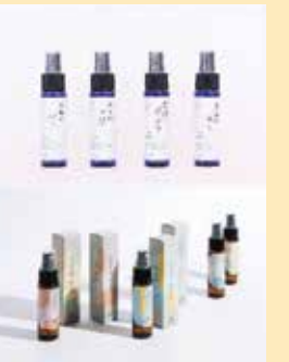
敦香 (商標第 5946175 号) 敦賀の杜 (商標第 5946176 号) 敦賀の水辺 (商標第 5946177 号) 他

商標出願の手続きに関する支援だけかと思っていましたが、その後も販路開拓や様々な専門家の支援も無料で受けることができて本当にありがたいです。