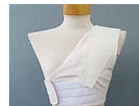
埋め込み型ベースメカ 固定用サポーター