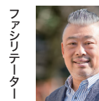
ファシリテーター