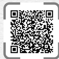
INPIT 相談支援ポータルサイト