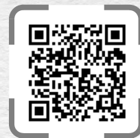
特許情報プラットフォーム J-PlatPat