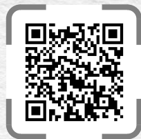
INPIT 長野県知財総合支援窓口

*伊那商工会議所では弁理士は同席しません。支援担当者がお伺いし、内容に応じて後日弁理士等が対応します。