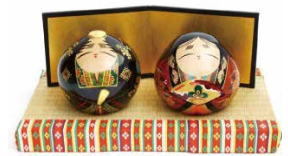
（コラボレーションの一例）

地域ブランドが融合したら何が起る?! 地域・業種の垣根を越えた出会いが生み出す、新たな価値や魅力。地域ブランドコラボレーションの仕掛け人である3名の専門家が、実際に生まれた成果とその可能性について解説します。 ※地域ブランドフェアの一部として実施します。立ち見でもご覧いただけますが、お席をご希望の方は下記「成果報告会参加方法」をご確認ください。