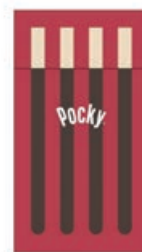
意匠登録 第1626108号 江崎グリコ株式会社