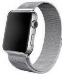
意匠登録 第1547821号 アップル インコーポレーティッド