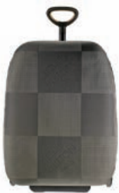
意匠登録 第1244162号 ルイ ヴィトン マルシェ