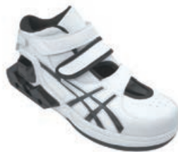
意匠登録 第1403965号 株式会社アシックス