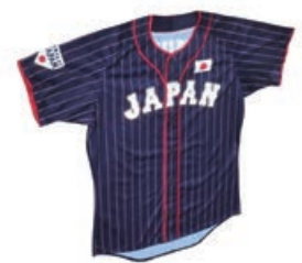
意匠登録 第1596978号 一般社団法人日本野球機構