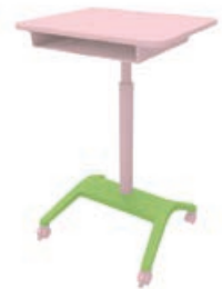
意匠登録 第1575360号 株式会社岡村製作所