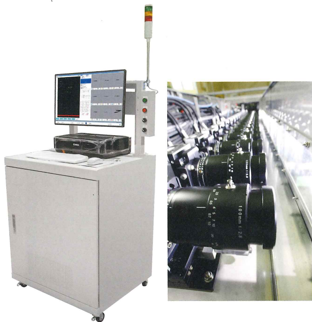
表面欠陥検査装置