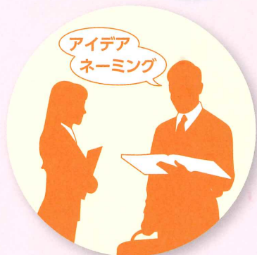
アイデア、商品名の 権利化 支援