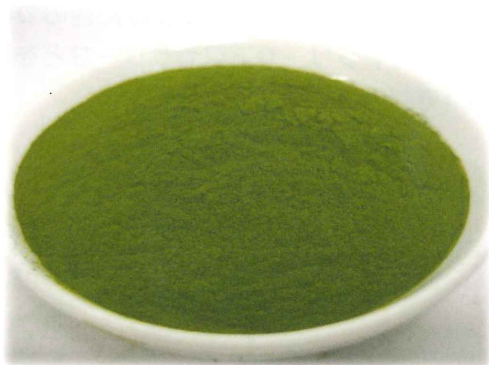
吉笑 商標登録第6058871号