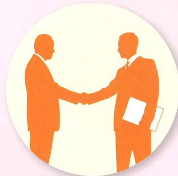
知的財産の 専門家 による支援