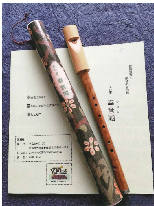
ゆきねこ／幸音湖 商標登録第6155976号