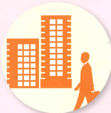
担当者が 企業を訪問 して支援