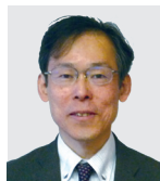
川東ナビゲーター

知財制度の説明、 先願調査のサポート、 電子出願のサポート、 知的財産に関する 各種支援策の紹介