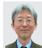
吉井ナビゲーター