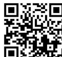
よろずホームページ