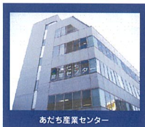
あだち産業センター