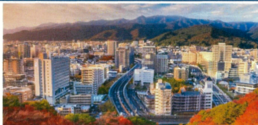
「2100年の天童市街イメージ」