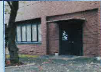
③右手「志」の文字が書いてあるドアが入口