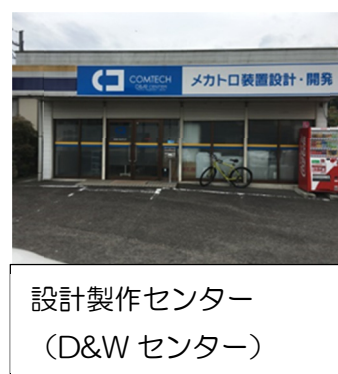
設計製作センター (D&W センター)

また、自社製品の生産・開発以外にも、設計・生産のアウトソーシング業務も行っており、多様なニーズにお応えしております。