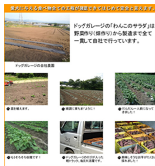
自社農園での作付け風景

「飼い主が食べて美味しい物を愛犬に食べさせ、人が食べられない物を愛犬に与えない」を信念とし、野菜も一度蒸してからペースト化して成型乾燥した「わんこのサラダ」、馬肉をボイルし乾燥させて粉末化した「馬肉のふりかけ」、A5ランクの米沢牛を加熱調理後乾燥した「米沢牛ジャーキー」、米を蒸して成型後に油で揚げた「お米のチップ」などが好評です。