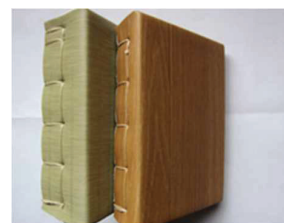
畳と同様にシート材は畳床の側面に縫い付けています。

近年、畳の需要が減少しており、「床材の中で群を抜いて衝撃吸収に優れている畳に新たな機能性を加え、現在のライフスタイルに受け入れられる畳にしたい!」との想いから、新しいジャンルの畳『リフォーム畳』を開発し、新たな商品として販売しております。