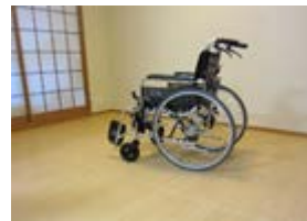
この床は、畳です。「リフォーム畳®」です。

近年、畳の需要が減少しており、「床材の中で群を抜いて衝撃吸収に優れている畳に新たな機能性を加え、現在のライフスタイルに受け入れられる畳にしたい!」との想いから、ストレスフリーな快適生活を目指す床材で、新しいジャンルの畳『リフォーム畳』を開発し、新たな商品として販売しております。