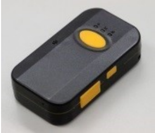
hito 端末 FB200type

骨伝導ワイヤレスヘッドセット「VOCE-rable」「VOCE-rable egg」は、スマートフォンと Bluetooth 接続することで、通話をしたり音楽を聴いたりできる製品です。骨伝導スピーカーを採用し、耳の穴を塞がないため、走行中も安全に使用可能です。ツーリング中のコミュニケーションにより楽しさを共有できるだけでなく、走行中の障害物や車両接近などを伝えることができる、安全・安心に繋がる製品となっています。商標登録第 5802014 号、意匠登録第 1543388 号、特許出願中。