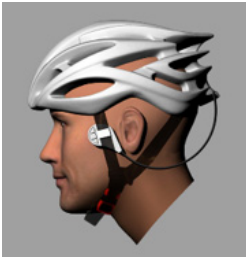
骨伝導ワイヤレスヘッドセット 「VOCE-rable」

骨伝導ワイヤレスヘッドセット「VOCE-rable」「VOCE-rable egg」は、スマートフォンと Bluetooth 接続することで、通話をしたり音楽を聴いたりできる製品です。骨伝導スピーカーを採用し、耳の穴を塞がないため、走行中も安全に使用可能です。ツーリング中のコミュニケーションにより楽しさを共有できるだけでなく、走行中の障害物や車両接近などを伝えることができる、安全・安心に繋がる製品となっています。商標登録第 5802014 号、意匠登録第 1543388 号、特許出願中。