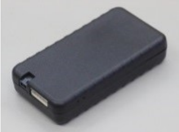
mono 端末 FB100type

当社の強みは、地方が抱えている課題の解決を目的とした製品づくりです。二次交通網が脆弱な地方で電動アシスト自転車と組み合わせて、初めて訪れる観光地でも迷わず巡ることができる多言語音声ガイド・ナビ端末「ナビチャリ」を開発しました。また、高齢者の見守り端末としての活用が想定される「hito 端末 FB200」や車両の位置情報や危険運転箇所を検知できる「mono 端末 FB100」を開発し、安全安心な社会の実現に貢献しています。